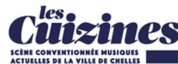
Projet de beatmaking avec la classe de SEC 06 de M. Foucault