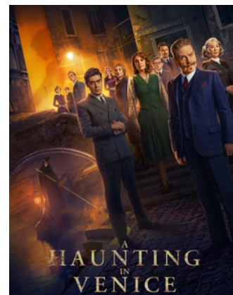
Sortie effectuée avec les élèves de 1STI2D, les PREM 7, 8, 9 & 10 et les 1STMG3 de Mme SIMSEK